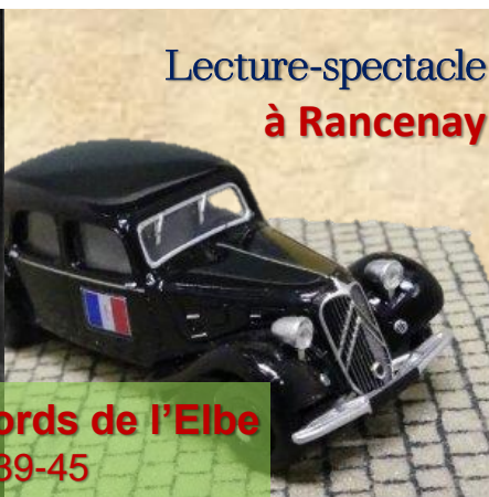
Lecture-spectacle à Rancenay

parcours-spectacle 25, 27 juillet 21h 22, 23 août 20h30